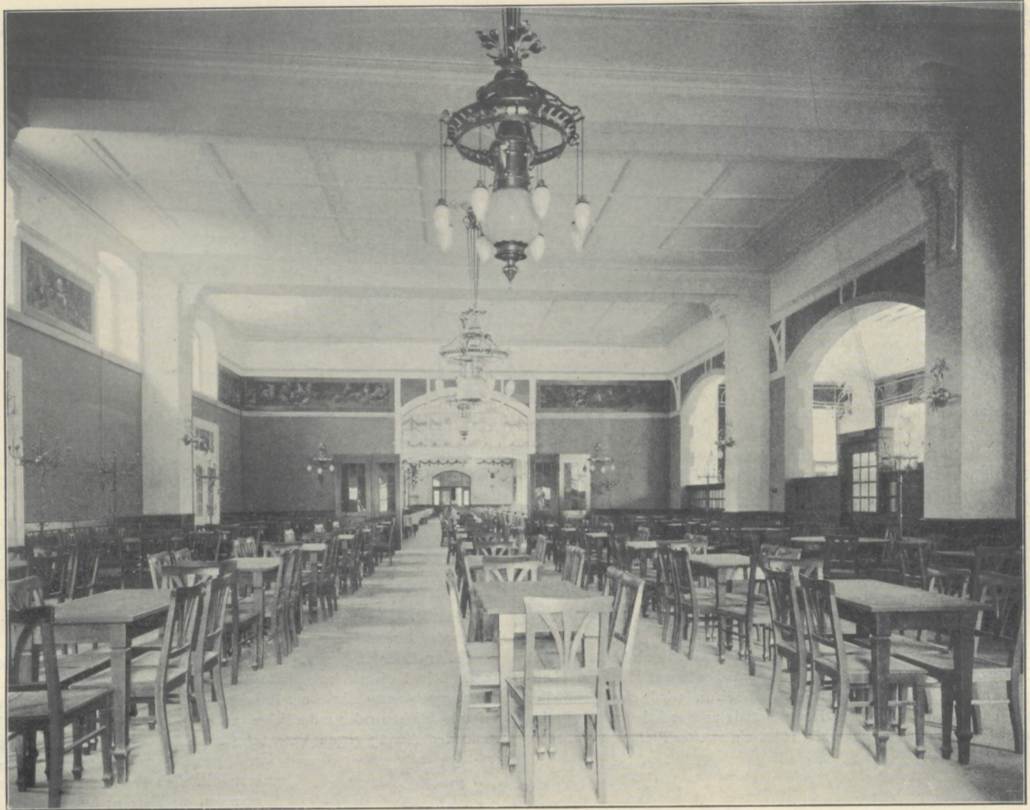
Saalansicht des Restaurants in Hundekehle bei Berlin. (Tafel 91.)