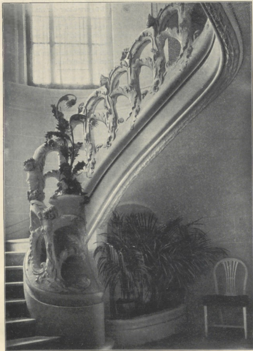
Treppe im Hause der Yvette Guilbert.