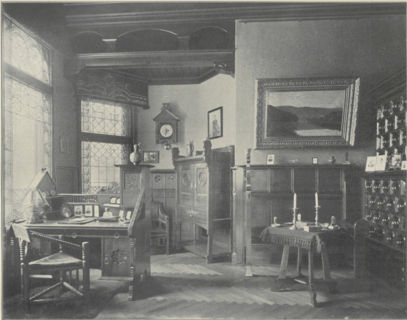
Herrenzimmer der Villa Busse in Westend-Berlin (ausgeführt von der Firma J. C. Pfaff.)