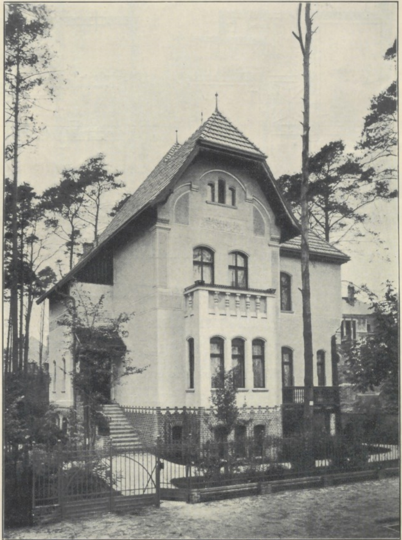
Villa im Grunewald bei Berlin.

und in klarer, sofort verständlicher Form Aufschluss gibt über alle nur möglichen Fragen, die dem Praktiker bei seiner ebenso schwierigen wie verantwortungsvollen Berufstätigkeit fortwährend entgegenreten. Allen diesen Ansprüchen genügt das vorliegende Werk, welches, wie kein anderes Buch auf dem weiten Gebiete der Bautechnik, in plan- und