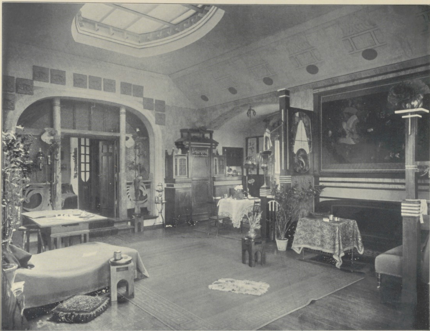
Landhaus in Gross-Lichterfelde (Halle).