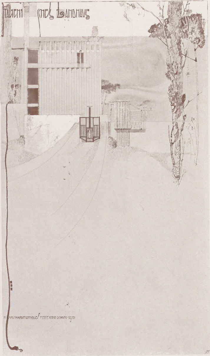
ITALIENISCHES LANDHAUS. □ □ KARL MARIA KERNDLE.