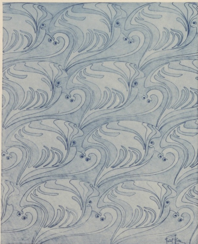
PAUL ROLLER. VORSTUDIE ZU EINEM MUSTER FÜR IRISIRENDEN SEIDEN. □ □ □ STOFF. II. JAHRGANG. □ □ □