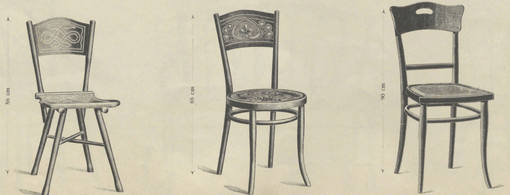
Nr. 121 Nr. 122 Nr. 123