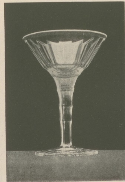
GLASGEGENSTÄNDE ARCHITEKT E. HOPPE