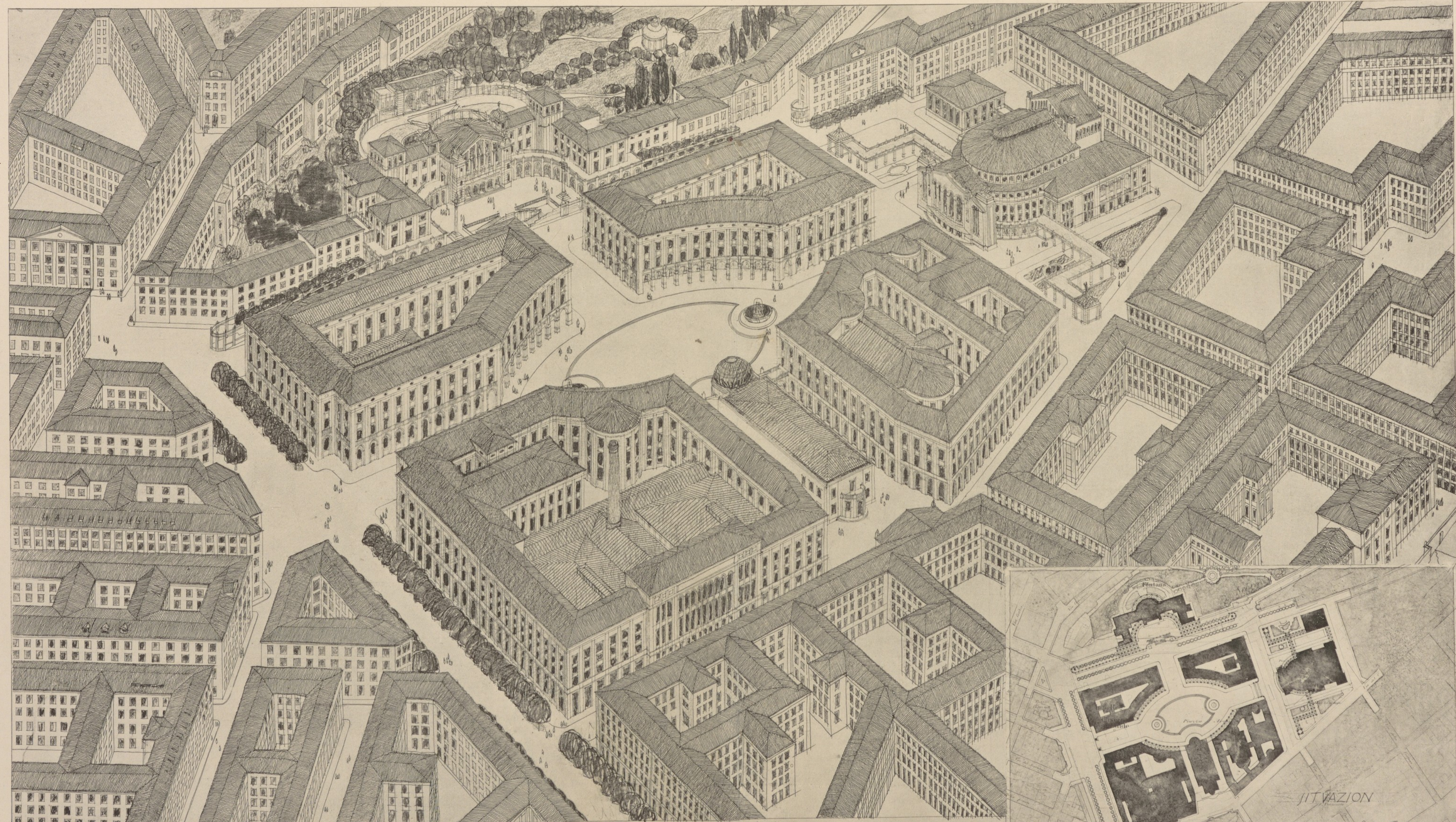
STUDIE FÜR DIE VERBAUUNG DER KASERNENGRÜNDE IN TRIEST NACH GEGEBENEM PROGRAMM UM EINEN PLATZ GRUPPIERT: GEBÄUDE FÜR DIE KUNSTHISTORISCHEN / FÜR DIE NATURHISTORISCHEN SAMMLUNGEN / FÜR DIE STADTBIBLIOTHEK / DAS MUSIKONSERVATORIUM / DIE VOLKSHYMNISCHE UNIVERSITÄT UND EIN VOLKSBAD / IN EINER AXE DAS THEATER / IN DER ANDEREN DAS AQUA- RIUM / AM BERGE EIN CASINO FÜR DIE TRIESTER GESELLSCHAFT / VOGELPERSPEKTIVE VON EINER HÖHE VON 700 METERN.