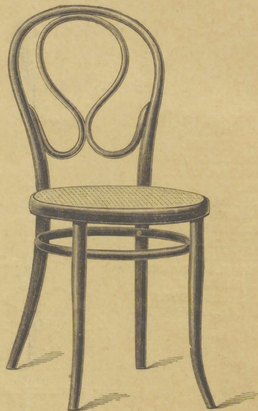
Nr. 20 .....M. 6.50 mit Verbindungen " 7.10