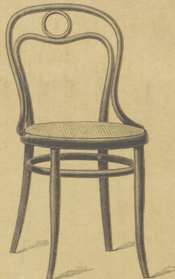
Nr. 31 M. 7.20 directe Verbindung zwischen Sitz und Lehne.