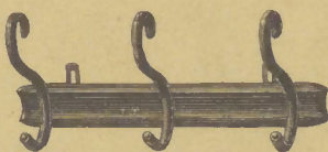
Kleiderrechen Nr. 2 mit 3 Haken M. 4.—