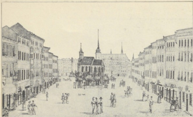
Beispiel und Gegenbeispiel

Der grosse Platz mit der Michaeli-Kirche im Jahre 1820