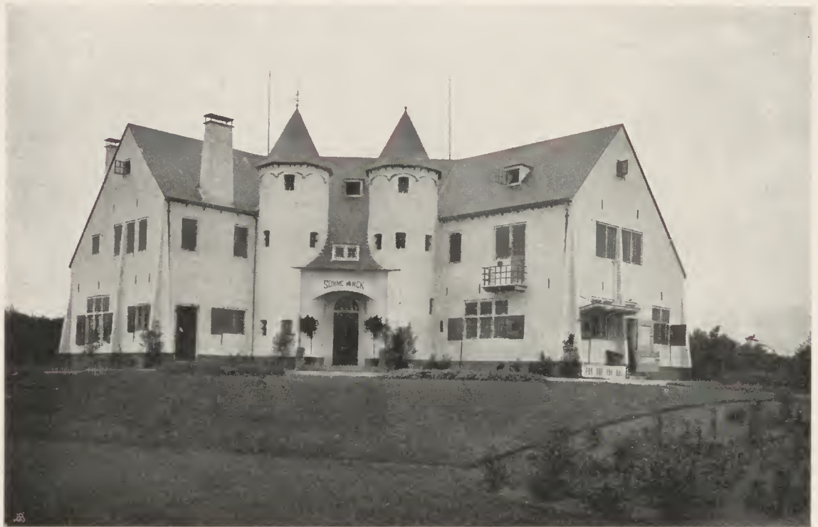
ARCH. J. LONDON-HAARLEM