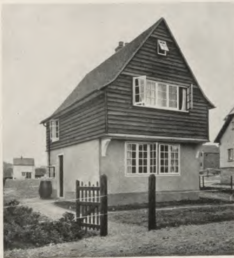
MODELL EINES BILLIGEN SOMMERHÄUSCHENS