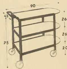
T 386 THONET