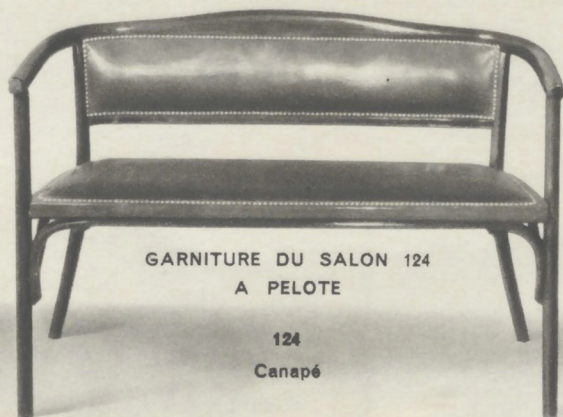
GARNITURE DU SALON 124 A PELOTE