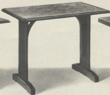
Table avec ou sans barre cuivre, châssis fonte.