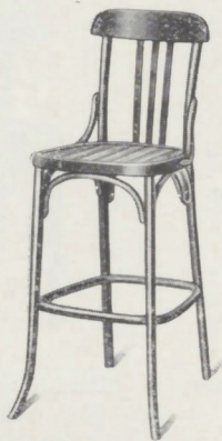
Chaise haute N° 185 H, à 1 cercle, arcs et contreforts. Siège \square 40/41 Hauteur 55 à 75 c/m