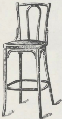
Chaise de caisse N° 72 à 1 cercle arcs et contreforts. Siège \square 40/41 c/m H r 55 à 75 c/m N° 73 avec châssis mobile garni