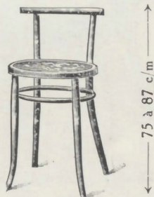
Tabouret N° 98 avec dossier Siège \circ 39 c/m à 1 cercle Hauteur 48 c/m N° 99 à deux cercles Hauteur 60 c/m

(Le modèle 103 se fait en section de 2 m. maximum)