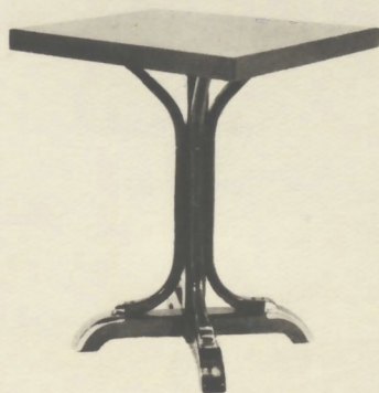
Table ou guéridon, piètement bois verni avec colonnes et application duralumin.