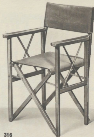
Se fait verni ou laqué, garni velours ou tissu fantaisie ou pégamoïd.