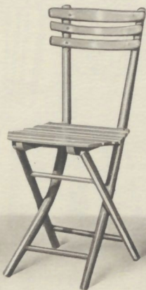
Chaise pliante vernie ou laquée. Siège de 36×40.