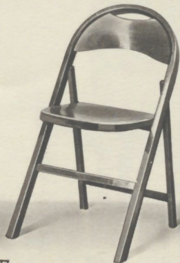
Chaise pliante vernie ou laquée. Siège 36×40.