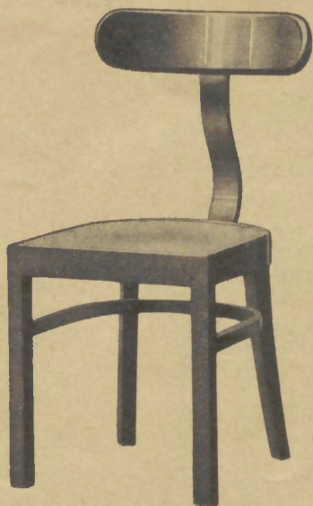
401 42×40 cm