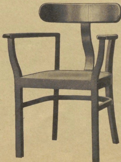
411 44×49 cm