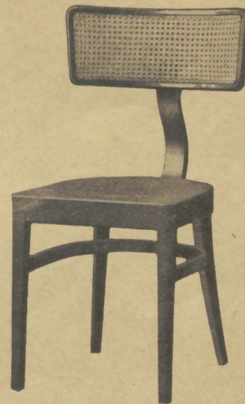
402 42×40 cm