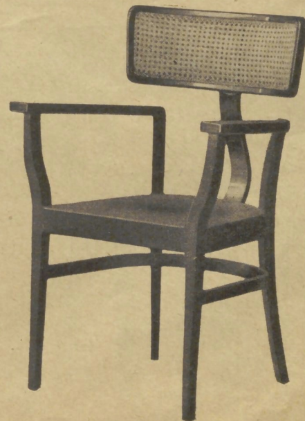
412 44×49 cm