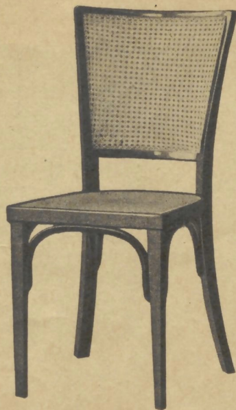
328 40×40 cm