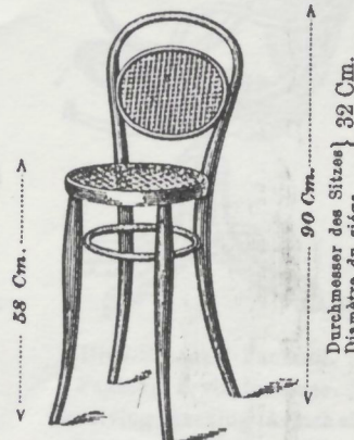
Laden-Sessel mit Rohrlehne. Chaise de boutique avec dossier canné. Shop chair, cane back. Sedia da negozio con spalliera. M. 6.60

90 Cm. Durchmesser des Sitzes } Diamètre du siège } 32 Cm.