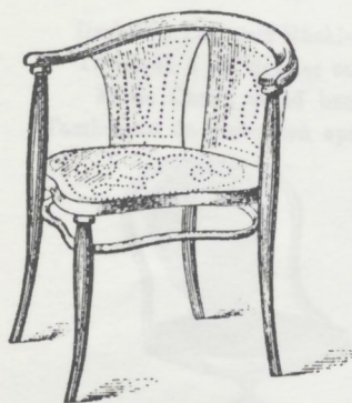
Schreibtisch-Fauteuil. Fauteuil de bureau. Armchair of writing desk. Poltrona da scrittojo M. 16.—