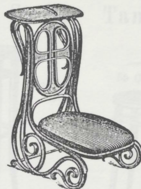
Betschemel (Gestell zum Polstern) Prie-Dieu à garnir Priedieu (Frame for Upholstering.) Inginocchiatoio (Fusto da imbottirsi) M. 36.—