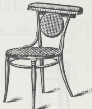
Rauch-Sessel. Fumeuse cannée, accoudoir garni Repe. Smoking Chair. Sedia da Fumare. M. 14.—