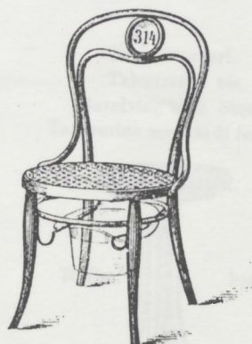
Concertsessel Nr. 31 Chaise avec porte chapeau et numéro d'ordre. Sedia per concerto. M. 8.40