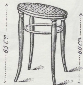
Harmonium-Stockerl. Tabouret pour orgue. Harmoniumstool. Tamburino da armonium. M. 6.—