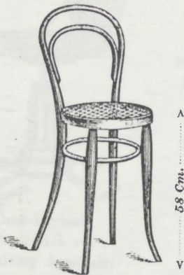
Laden-Sessel. Chaise de boutique. Shop Chair. Sedia da negozio. M. 5.60