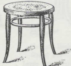
Stockerl 47 Cm. grosser Holzstool. Tabouret 47 Cm. large siège en bois. Stool 47 Cm. large wood seat. Tamburino 47 Cm. grande sedile di legno. M. 4.50