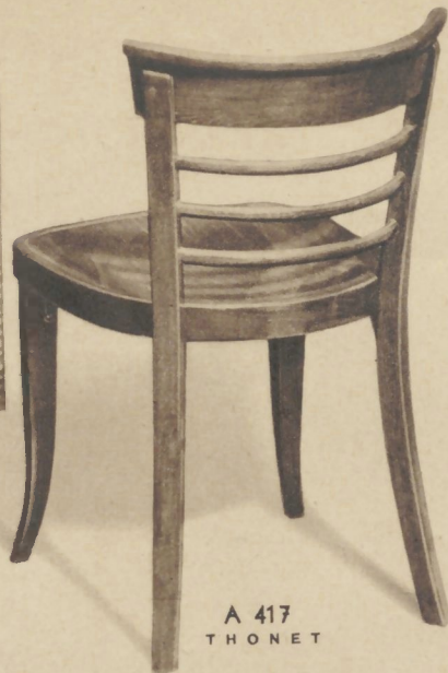
A 417 THONET

Stoel A 417 een sierlijk en toch onverwoestbaar mo- del.