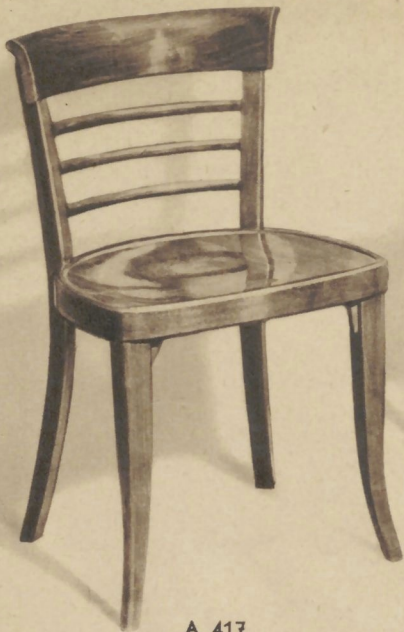
A 417 THONET