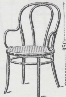
N. 18.— — Poltrona — L. 17.—