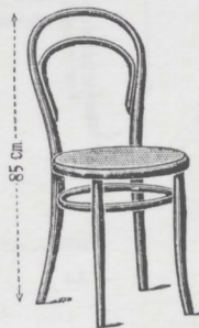
N. 14 1/2 — Sediolina — L. 8.75 Sedile 37 centimetri