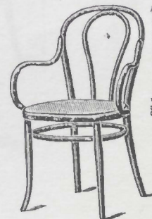
N. 18 1/2 — Poltroncina — L. 15.25