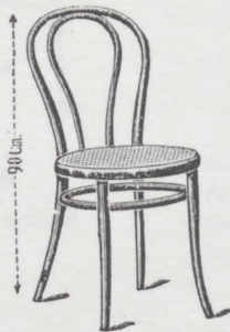
N. 18 — Sedia — L. 9.75