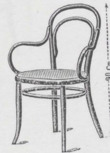
N. 14 1/2 — Poltroncina — L. 15.— Sedile 45 centimetri