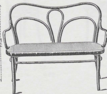
N. 18 Canapè, Sedile lungo 111 cm. L. 36.— " " " 135 " " 41.—