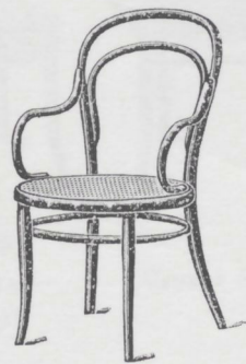
N. 14 — Poltrona — L. 16.50 Sedile 52 centimetri