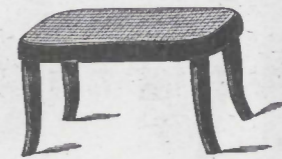
Nr. 3 fl. 1.75

(Pag. 91.) Sitz geflochten, perforirt oder „Flechtmuster“.