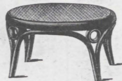
Nr. 3 fl. 2.75