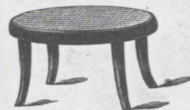
Nr. 1 fl. 1.75

(Pag. 91.) Sitz geflochten, perforirt oder „Flechtmuster“.