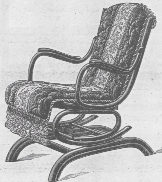
Nr. 18 mit Schabracke.