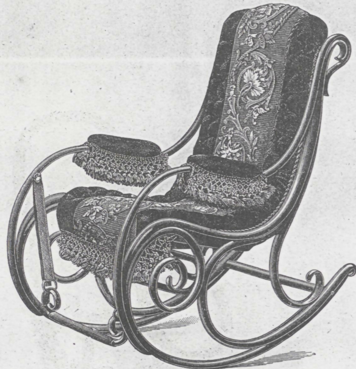
Nr. 1 mit Peluche gepolstert.