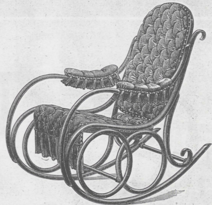
Nr. 4 mit Leder gepolstert.