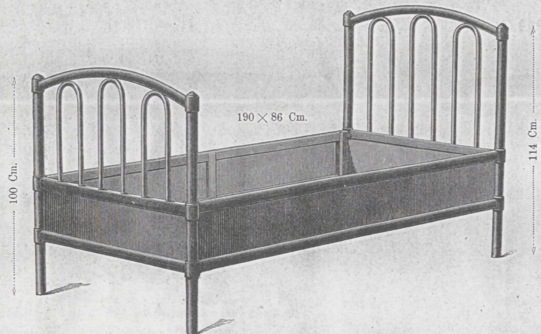
Bett Nr. 5 { mit Holzboden..... fl. 32.— mit Rohrboden ..... 40.—

Angesetzte Maße zeigen die inneren Dimensionen der Betten.