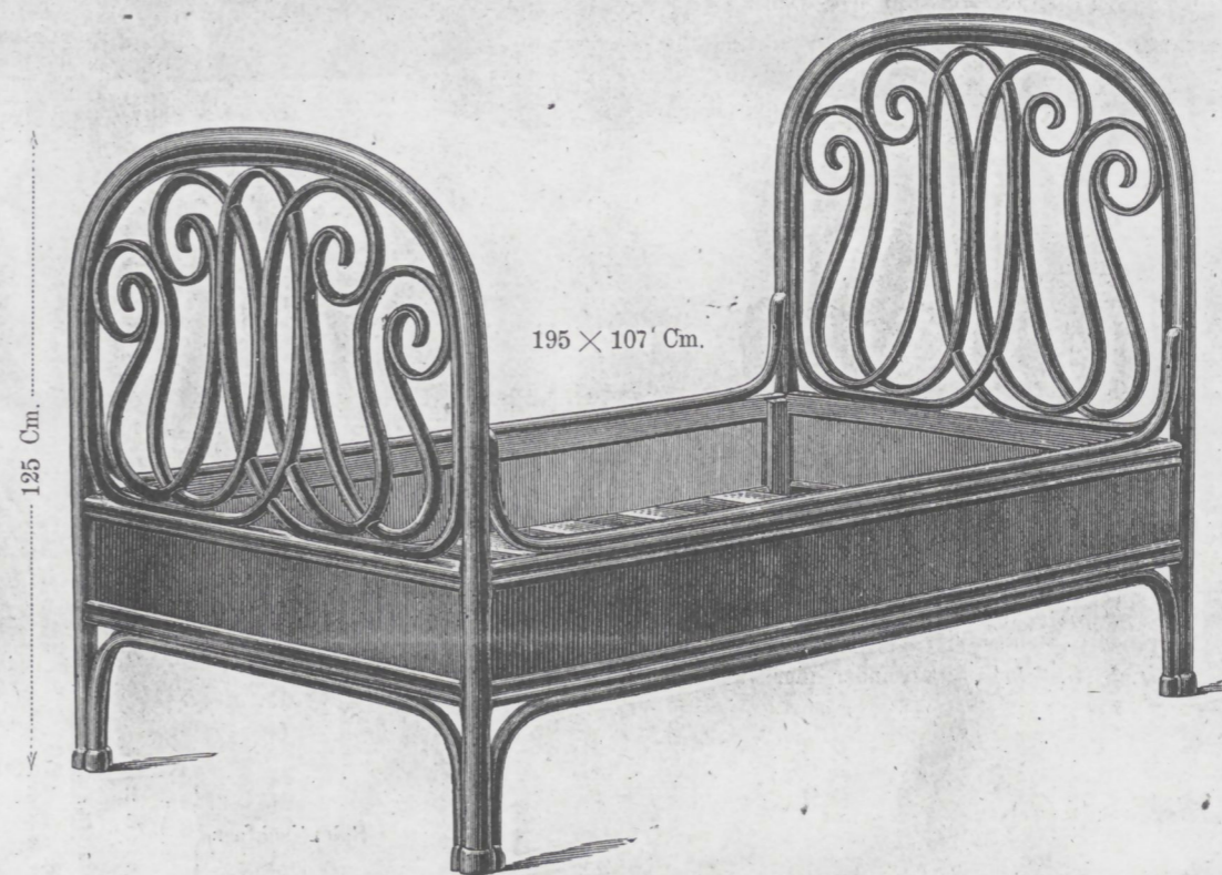
Bett Nr. 4 { mit Holzboden..... fl. 66.— mit Rohrboden ..... 75.—