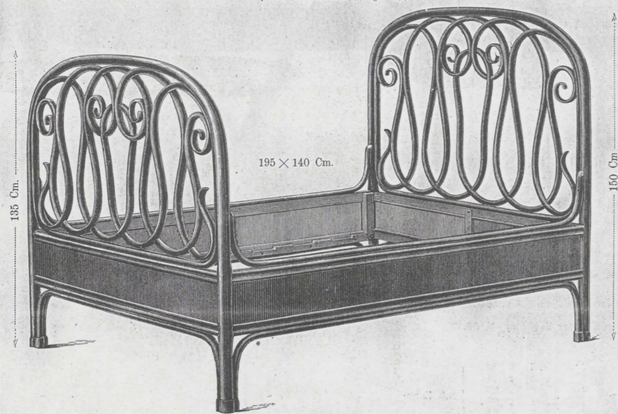
Doppelbett Nr. 3 { mit Holzboden..... fl. 75.— mit Rohrboden ..... 88.—

Angesetzte Maße zeigen die inneren Dimensionen der Betten.