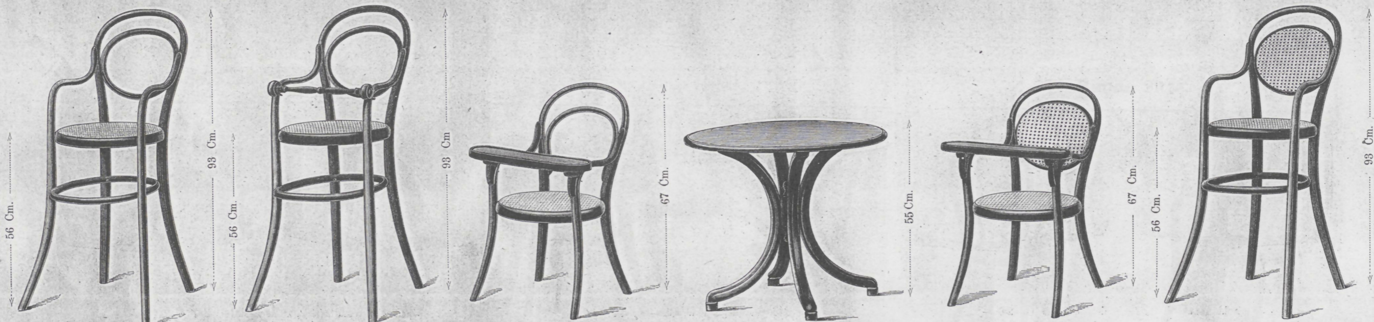
Kinderfauteuil Nr. 1, hoch fl. 4.—