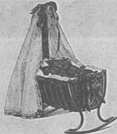
Ansicht einer montirten Wiege