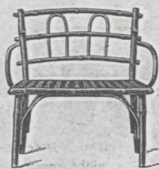
Canapé Nr. 3 ..... fl. 3.— überzogen ..... „ 3.50