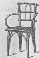
Fauteuil Nr. 3 ..... fl. 2.25 überzogen ..... „ 2.50