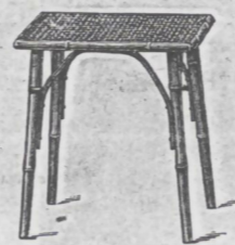
Tisch Nr. 3 ..... fl. 2.— überzogen ..... „ 2.50