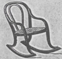
Schaukelfauteuil Nr. 1 fl. 2.—