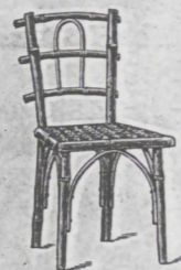
Sessel Nr. 3 ..... fl. 2.— überzogen ..... „ 2.25