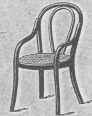
Fauteuil Nr. 1 fl. 1.25