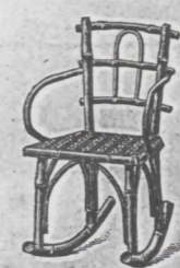
Schaukelfauteuil Nr. 3 .. fl. 2.75 überzogen ..... „ 3.—