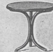
Tisch Nr. 1 fl. 2.—