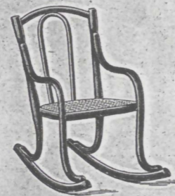
Schaukelfauteuil Nr. 2 fl. 2.75