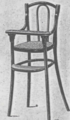
Speisesessel fl. 3.25