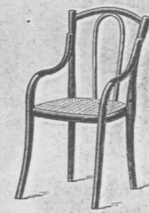
Fauteuil Nr. 2 fl. 2.—