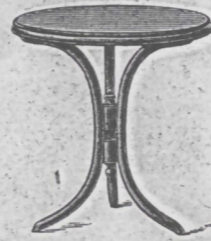
Tisch Nr. 2 fl. 2.50