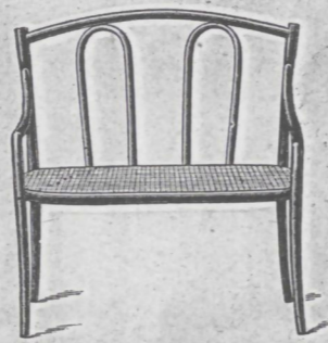
Canapé Nr. 2 fl. 3.—