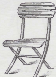
Sedia giardino per bambini. L. 6.25 pitturato ad olio. L. 5.50 greggio.