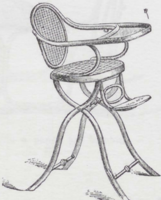
Sedia da tavola per bambini. Nr. 2. L. 32.—