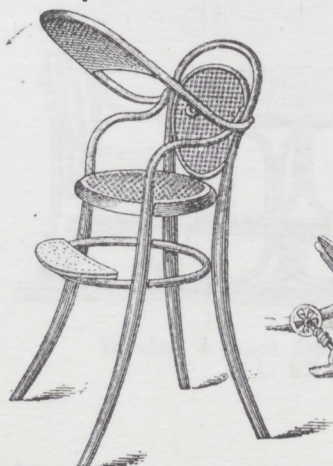
Sedia da tavola per bambini. Nr. 3. L. 20.—