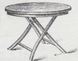
Tavola giardino piegabile per bambini. L. 15.50 pitturato ad olio. L. 14.25 greggio.

Vedere a pag. 67 alla fine le ultime novità.