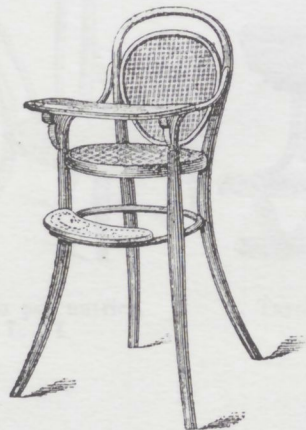
Sedia da tavola per bambini. Nr. 1. L. 18.—