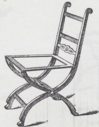
Sedia Nr. 3. da imbottirsi L. 48.—