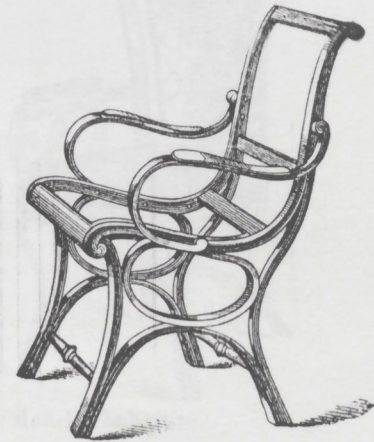
Poltrona Nr. 2 da imbottirsi L. 55.—