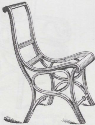
Sedia Nr. 2. da imbottirsi L. 43.—