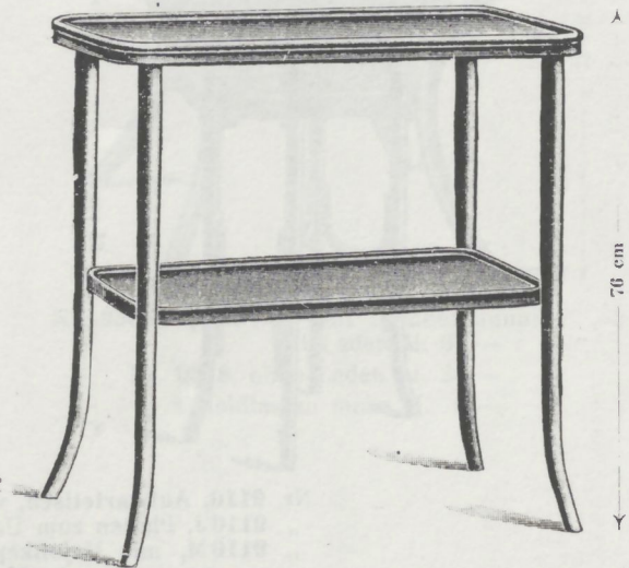
Nr. 9134, Aufwartetisch mit polierten Furnierbrettelplatten M. 20.—