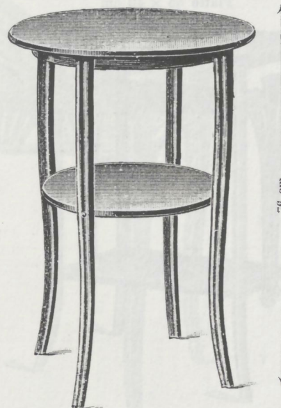
Nr. 9142, Aufwartetisch M. 16.—