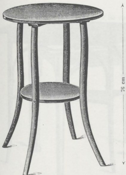
Nr. 9141, Aufwartetisch M. 11.—