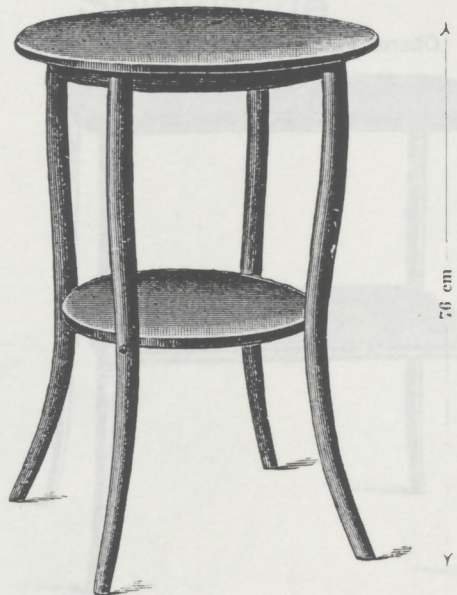
Nr. 9143, Aufwartetisch M. 11.75