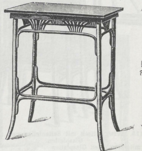
Nr. 9171, Aufwartetisch 55 \times 38 cm, mit polierter Platte M. 18.— Nr. 9171 J mit Platte zum Ueberziehen M. 18.50 Nr. 9171 M mit Platte für Majolikaplatte M. 18.50 Mit Majolikaplatte mehr M. 9.— netto Mit grünem Tuche mehr M. 2.— brutto