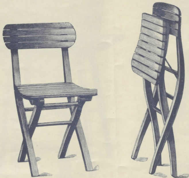
Nr. 14001. GARTENSESSEL

(zum Zusammenlegen und mit hohl gebogener Rückenlehne)