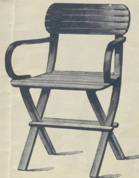
Nr. 14101. GARTENFAUTEUIL

roh . . . . . K 3.50 mit Ölanstrich in beliebiger Farbe . . . . . „ 4.50