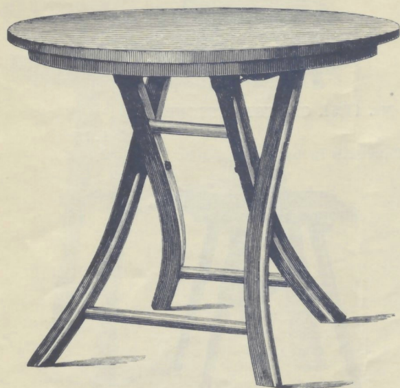
Nr. 14551. GARTENTISCH

roh . . . . . K 15.— mit Ölanstrich in beliebiger Farbe . . . . . „ 20.—