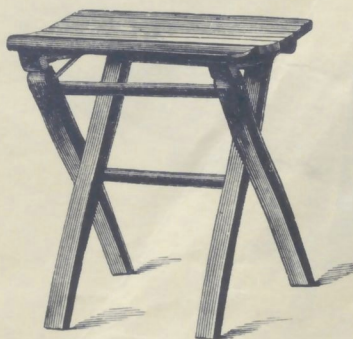
Nr. 14301. GARTENSTOCKERL

roh . . . . . K 2.25 mit Ölanstrich in beliebiger Farbe . . . . . „ 3.—