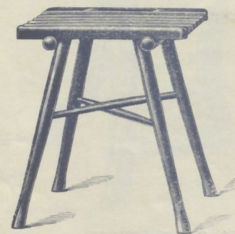
Nr. 14304. GARTENSTOCKERL

roh . . . . . K 1.25 mit Ölanstrich in beliebiger Farbe . . . . . 2.—