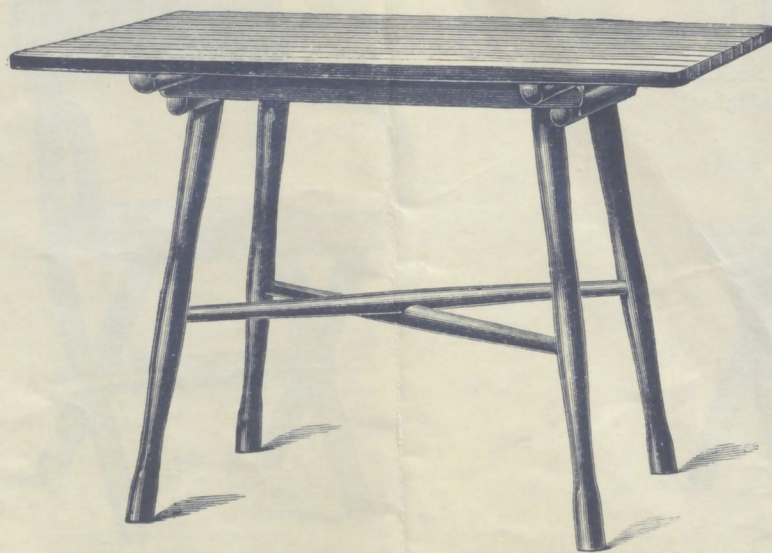
Nr. 14504. GARTENTISCH mit Lattenplatte 110 × 78 cm

mit Lattenplatte 78 × 54 cm oder rund 62 cm Durchmesser roh . . . . . K 8.50 mit Ölanstrich in beliebiger Farbe . . . . . 12.50