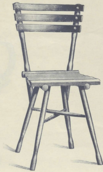
Nr. 14008/4. GARTENSESSEL

roh . . . . . K 3.60 mit Ölanstrich in beliebiger Farbe . . . . . 5.10