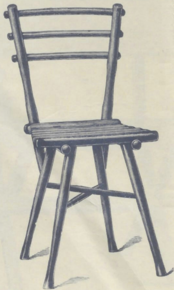
Nr. 14004. GARTENSESSEL

roh . . . . . K 3.60 mit Ölanstrich in beliebiger Farbe . . . . . 5.10