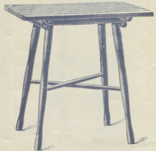
Nr. 14504 1/2 . GARTEN-(AUFWART-)TISCH (als Allonge zu gebrauchen zu Gartentisch Nr. 14504)

(= Gartensessel Nr. 14004 mit flachen Lehn- schwüngen von Nr. 14008) roh . . . . . K 3.75 mit Ölanstrich in beliebiger Farbe . . . . . 5.25