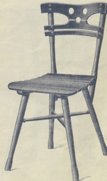
Nr. 14016. GARTENSESSEL roh . . . . . K 4.50 mit Ölanstrich in beliebiger Farbe . . . . . „ 6.— mit Causeusensitz (Nr. 14066) siehe Seite 10, Aufschlag „ —.50