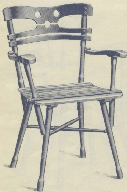
Nr. 14116. GARTENFAUTEUIL roh . . . . . K 8.— mit Ölanstrich in beliebiger Farbe . . . . . „ 10.50 mit Causeusensitz (Nr. 14166) siehe Seite 10, Aufschlag „ 1.—