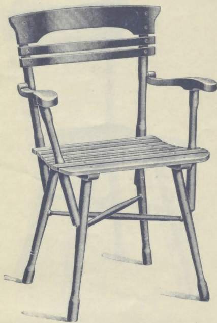
Nr. 14115. GARTENFAUTEUIL roh . . . . . K 7.75 mit Ölanstrich in beliebiger Farbe . . . . . „ 10.25 mit Causeusensitz (Nr. 14165) siehe Seite 10, Aufschlag „ 1.—