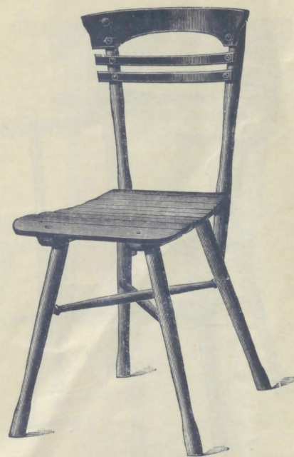
Nr. 14015. GARTENSESSEL roh . . . . . K 4.25 mit Ölanstrich in beliebiger Farbe . . . . . „ 5.75 mit Causeusensitz (Nr. 14065) siehe Seite 10, Aufschlag „ —.50