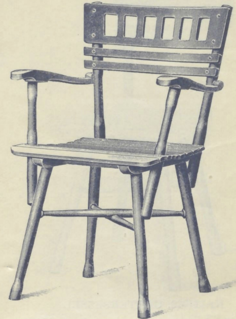
Nr. 14122. GARTENFAUTEUIL

roh . . . . . K 14.50 mit Ölanstrich in beliebiger Farbe „ 19.50