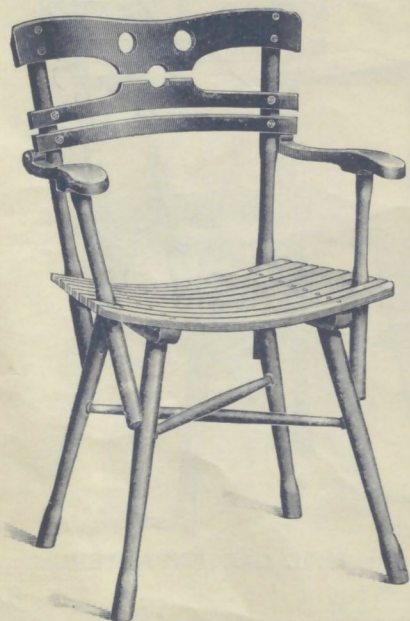
Nr. 14166. GARTENFAUTEUIL

somit Nummern-Erhöhung um 50 gegenüber der Nummer mit flachem Sitze.