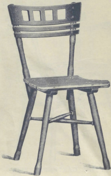
Nr. 14022. GARTENSESSEL

roh . . . . . K 4.75 mit Ölanstrich in beliebiger Farbe „ 6.25 mit Causeusensitz (Nr. 14072) siehe unten, Aufschlag . . . . . „ —.50