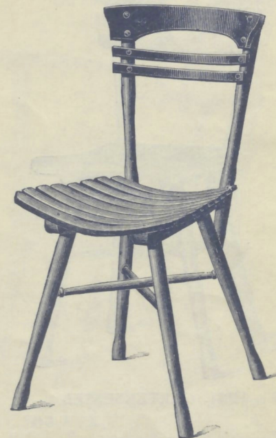
Nr. 14065. GARTENSESSEL

roh . . . . . K 9.— mit Ölanstrich in beliebiger Farbe „ 11.50