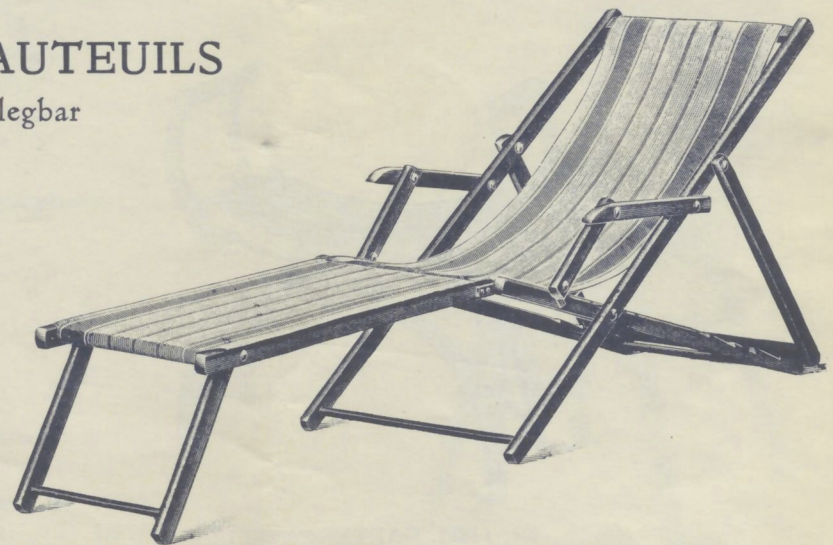
Nr. 6388. GARTENSTRECKFAUTEUIL

ganz flach zusammenlegbar und sehr leicht.