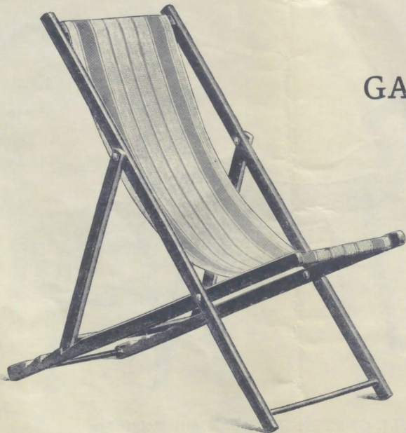
Nr. 6385. GARTENSTRECKFAUTEUIL

ohne Armlehnen, lackiert, mit Stoff . . . . . K 9.-- Nr. 6386. Derselbe, mit Fußlage wie Nr. 6388 . . . . . „ 13.--