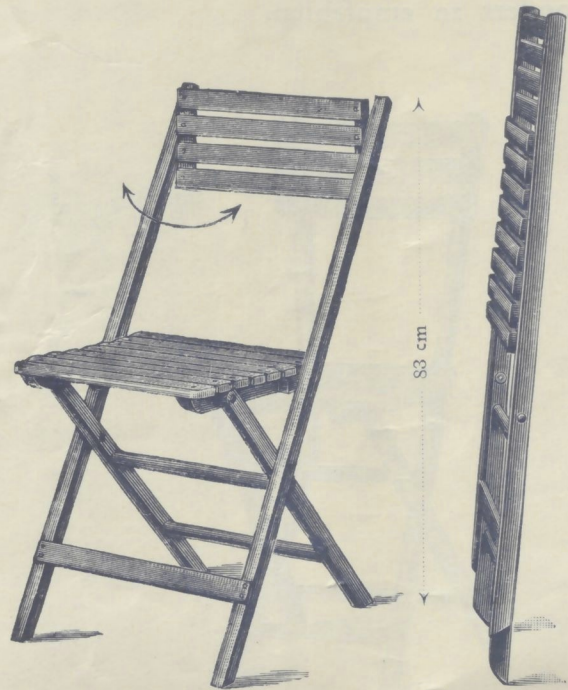
Nr. 14013. GARTENKLAPPSESSEL (mit beweglichen Rückenlehnleisten)