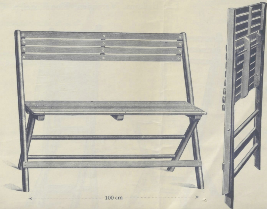
Nr. 14213. GARTENKLAPPBANK (mit beweglichen Rückenlehnleisten)