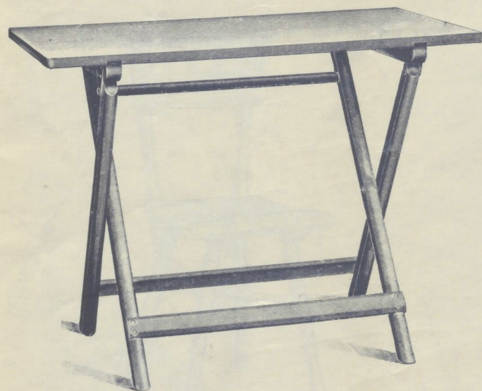
Nr. 14563. GARTENKLAPPTISCH mit massiver Platte 65 x 100 cm