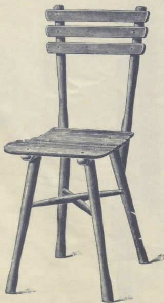
Nr. 14008 1 / 2 . GARTENSESSEL (mit kleinem Sitze)

roh . . . . . K 4.40 mit Ölanstrich in beliebiger Farbe . . . „ 5.90