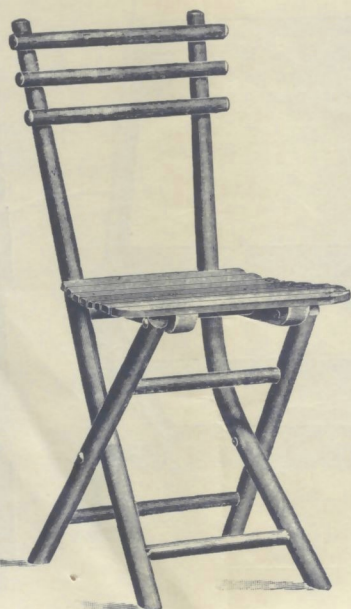
Nr. 14003 1 / 2 . GARTENSESSEL

Für Balkons, Veranden, Konditoreien, Cafés etc. besonders zu empfehlen.