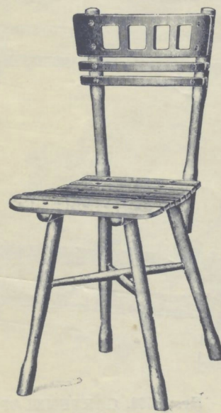
Nr. 14022 1 / 2 . GARTENSESSEL

roh . . . . . K 3.50 mit Ölanstrich in beliebiger Farbe . . . „ 4.75