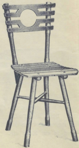
Nr. 14021 1 / 2 . GARTENSESSEL

roh . . . . . K 4.40 mit Ölanstrich in beliebiger Farbe . . . „ 5.90