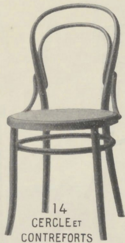
14 CERCLE ET CONTREFORTS