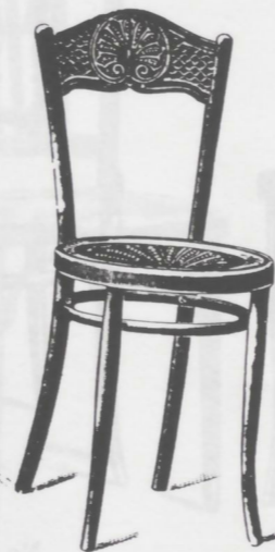
No 264 1/2