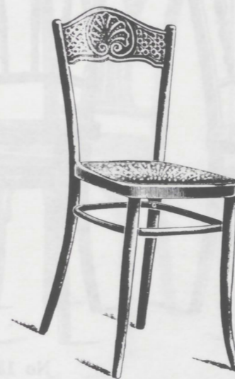
No 264 3/4