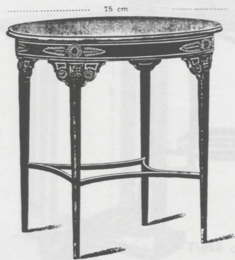
75 cm No 231/T