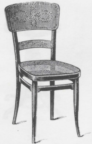
318 Double cercle, châssis B