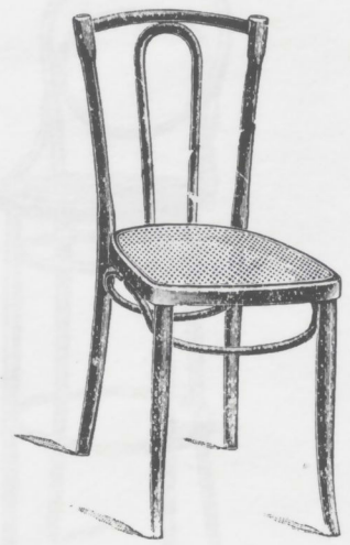
291 Châssis B, cercle brisé