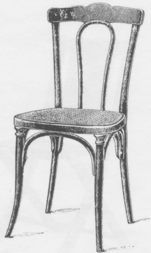
308 Châssis B, à arcs