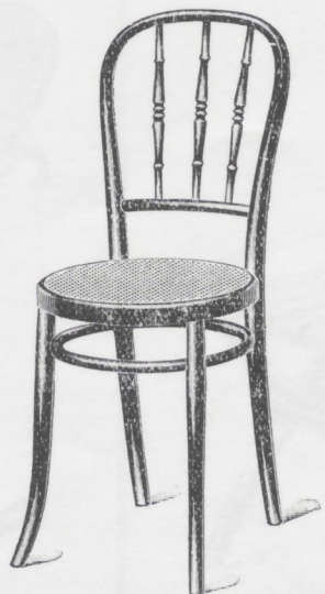
363 Châssis rond, simple cercle