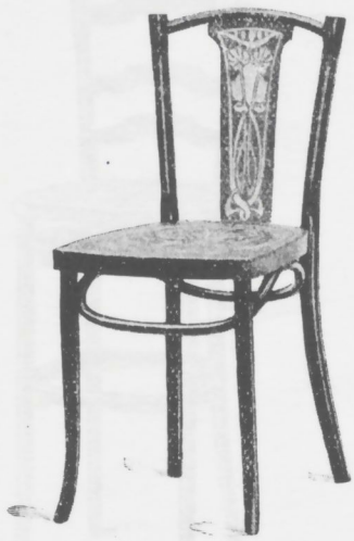
300 1/2 Châssis A, cercle brisé