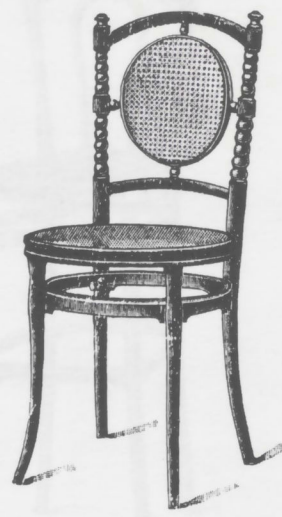
287 Châssis rond, double cercle