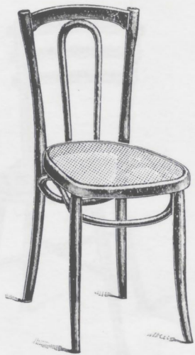
293 Châssis B, cercle brisé