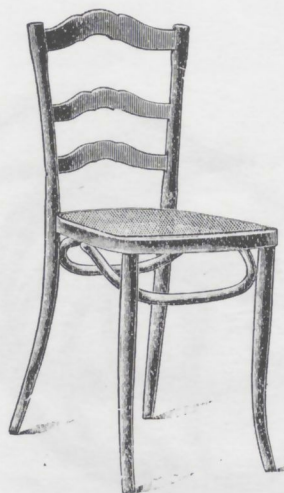
320 Châssis A, cercle brisé