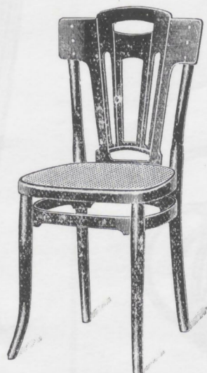
357 — Chaise