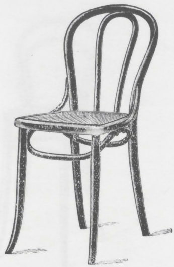
206 1/2 38 × 36 Cercle brisé et contreforts