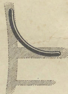
Contrefort Augmentation de 0 fr. 75 par chaise.

1 2 4 2 1 2 7 ~~~~~ POUR LES COMMANDES, bien préciser d'après les indications ci-dessous :