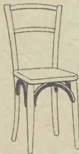
Arcs Augmentation de 1 fr. par chaise. » 1 50 » fauteuil. » 2 25 » canapé.