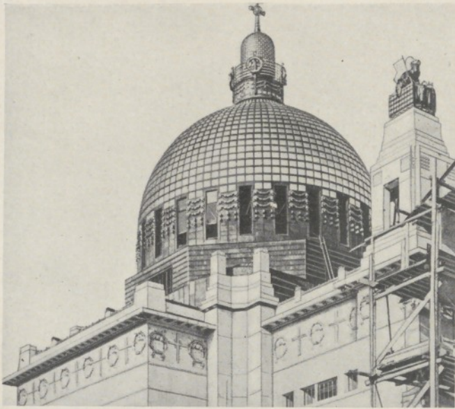
WIEN. Kirchenkuppel der Landes-Heil- und -Pflegeanstalt Architekt OTTO WAGNER