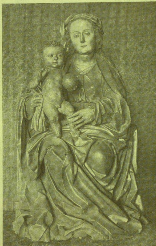
Fig. 3. Madonna mit Kind.

zum Teil eine ganz hervorragende. Es seien nur erwähnt die Arbeiten von Böcklin, F. A. v. Kaulbach, Lenbach (vier Werke), A. v. Keller und H. Thoma (drei Werke).