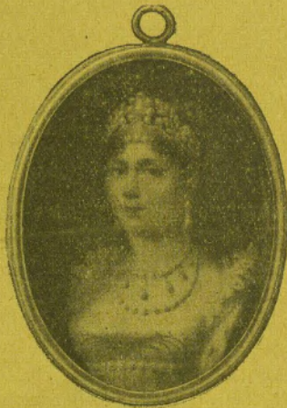
Fig. 1. Soiron: Kaiserin Josefine.

vertreten, so aus früher Zeit eine Arbeit Peter Olivers in alter köstlich emaillierter Kapsel; aus der Zeit um 1700 ein prächtiges Herrenporträt und aus der besten Zeit der engli-