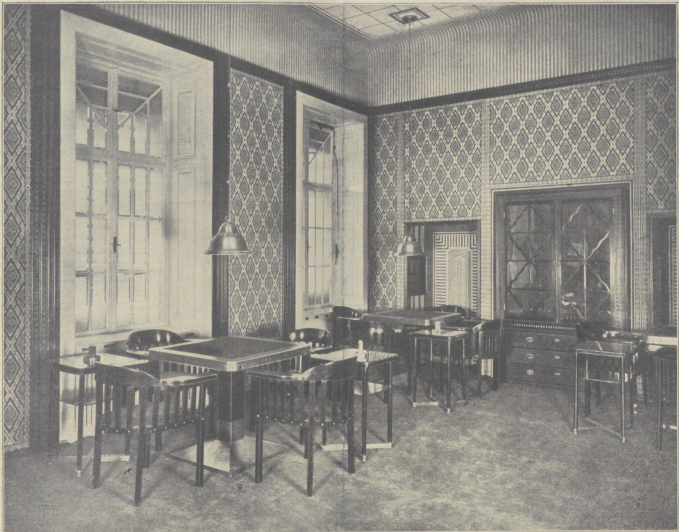
Architekt Karl Seidler: Spielzimmer eines Wiener Klubs.