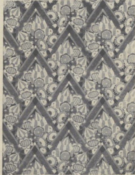
Architekt Guido Uxa: Tapetenentwürfe.