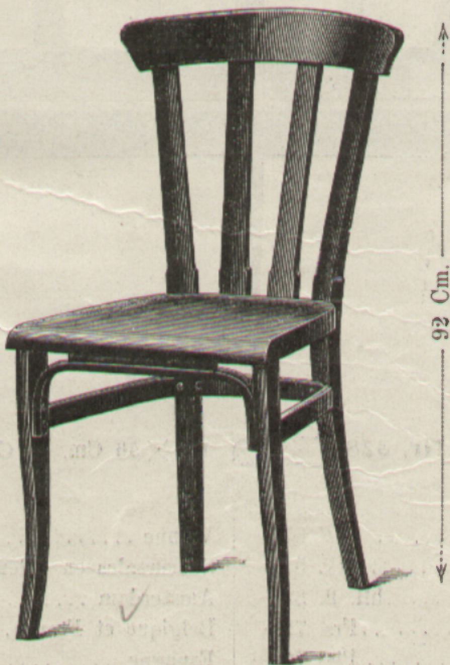
Sessel Nr. 328 44 × 41 Cm. — Chaise.

Poids brut, emballée en paille assurée des lattes 5·6 kilos.